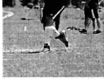
ブーメランを投げる筆者

ブーメランを投げる筆者 私生活がブーメランの周りをぐるぐる回り始めたのはそれからだ。三回生になり、無事にセミに入るのができた。